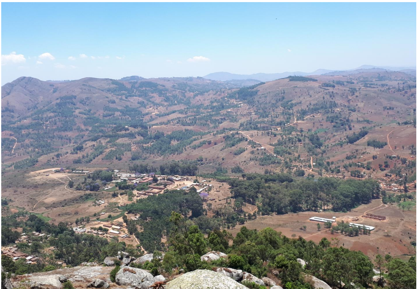
Rechts die Gebäude der Labor- und Krankenpflegeschule

Der Bau geht langsam aber stetig voran. Die Beschaffung von Baumaterial ist immer wieder schwierig und sorgt für Verzögerungen, besonders jetzt zu Beginn der Regenzeit. Die 30 km nach Mbinga sind Sandstraße und dafür gebraucht man schon 1 Stunde Fahrtzeit mit dem allradangetriebenen Geländewagen.