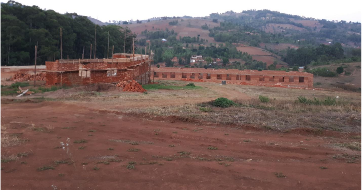
Die Gemeinschaftshalle/Mensa und Klassenzimmer

Diese Schule ist für Litembo und das Land sehr wichtig! Es fehlt an weiterführenden Schulen! Ohne Spenden könnte das Krankenhaus die Schule nicht bauen. Darum sind wir Euch so dankbar für Eure große Gabe! Jungen Menschen die Chance zu geben, ihre Zukunft selbst in die Hand zu nehmen, das ist doch wirklich das Beste was wir ihnen geben können. Sie leisten mit Eurer Spende nachhaltige Hilfe zur Selbsthilfe! Und das Krankenhaus bildet seinen Nachwuchs selber aus, wie praktisch!